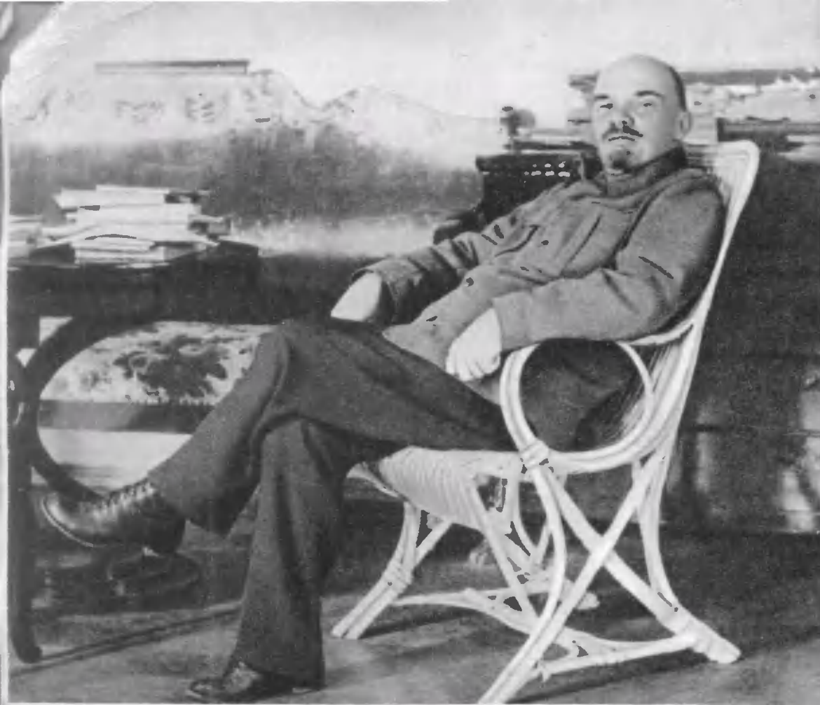
Горки. В. И. Ленин в рабочем кабинете. 1922 год.