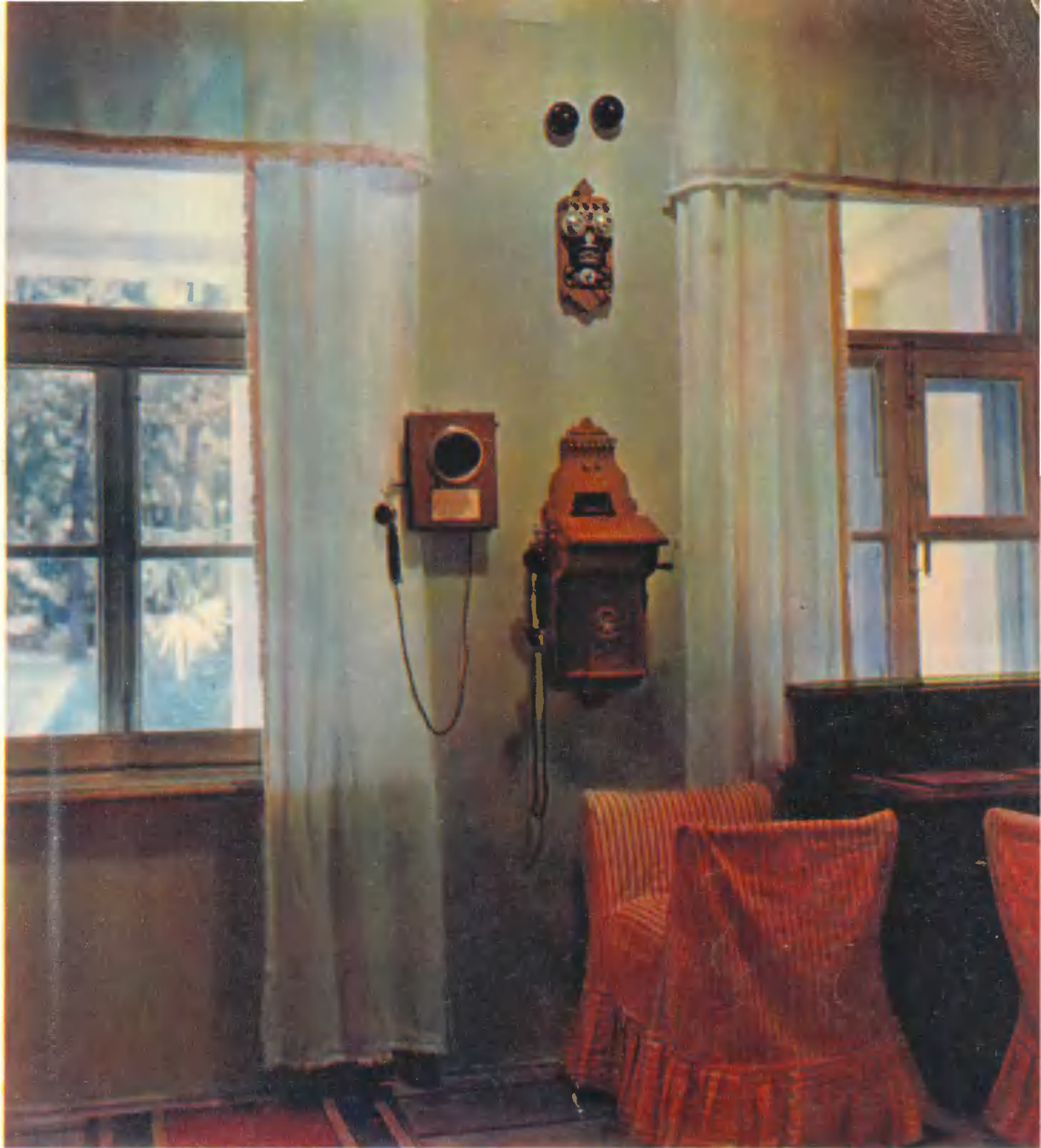
◀ Зимний сад. The conservatory Le jardin d'hiver. Wintergarten