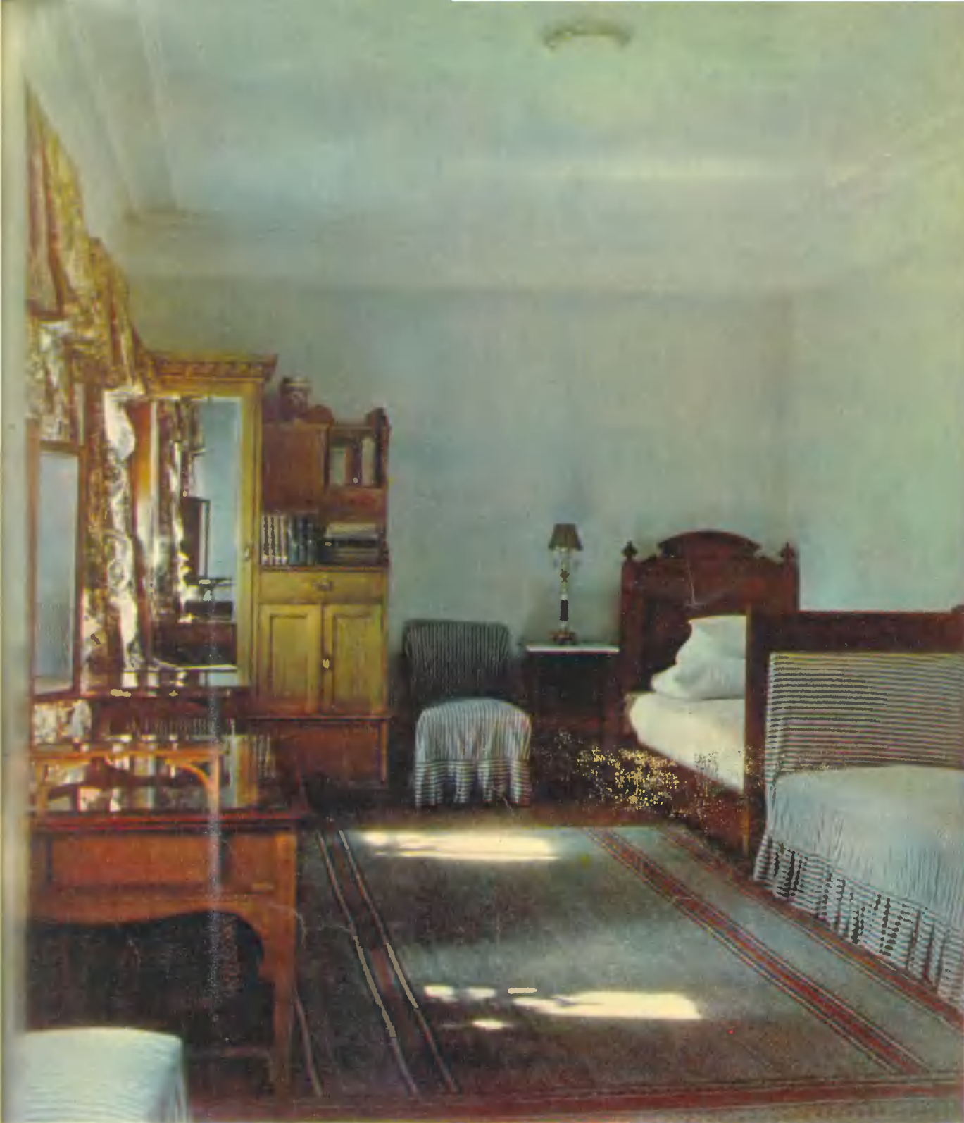
Комната Н. К. Крупской в северном флигеле. Krupskaya's room in the north wing La chambre de Kroupskaïa au pavillon Nord. N. K. Krupskajas Zimmer im nördlichen Flügel