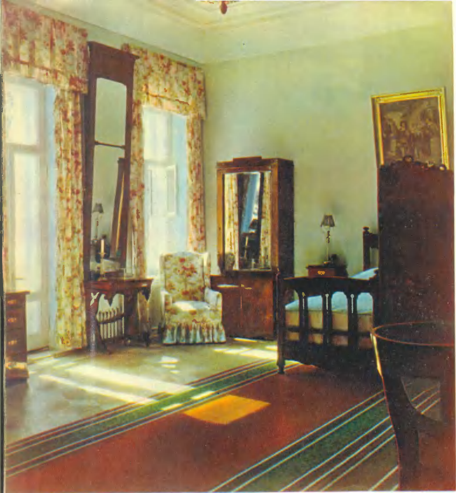
Рабочий кабинет В. И. Ленина и комната Н. К. Крупской Krupskaya's room La chambre de Kroupskaïa. N. K. Krupskajas Zimmer