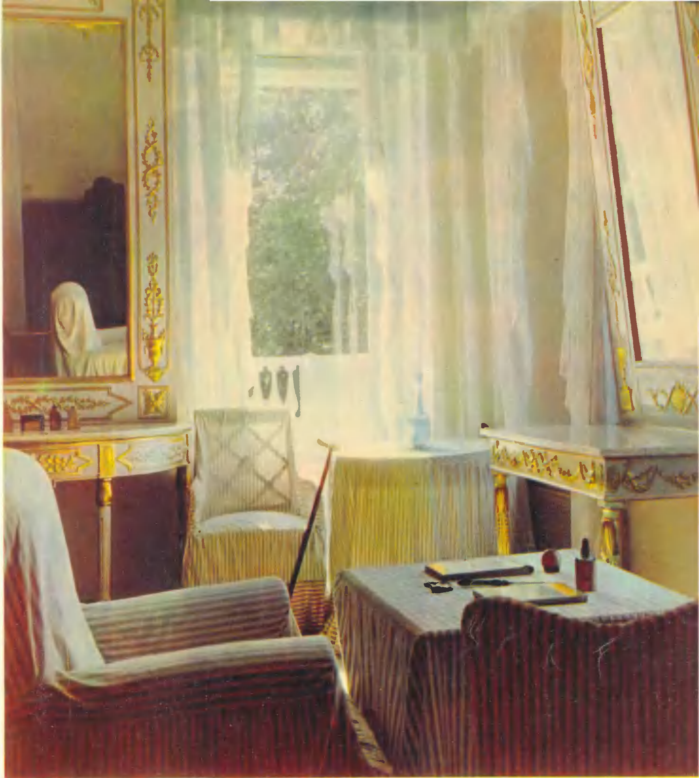
Комната В. И. Ленина.