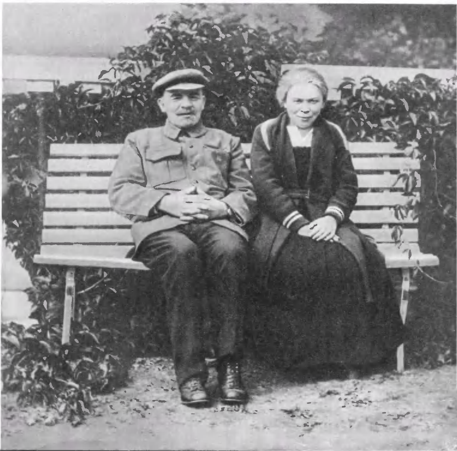
В. И. Ленин с М. И. Ульяновой. 1922 год. Lenin and Maria Ilyinichna Ulyanova, 1922 Lénine et M. Oulianova (1922). W. I. Lenin und M. I. Uljanowa, 1922