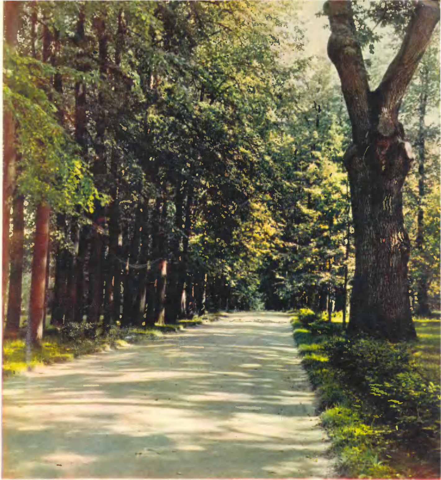
Парк. The park Le parc. Park