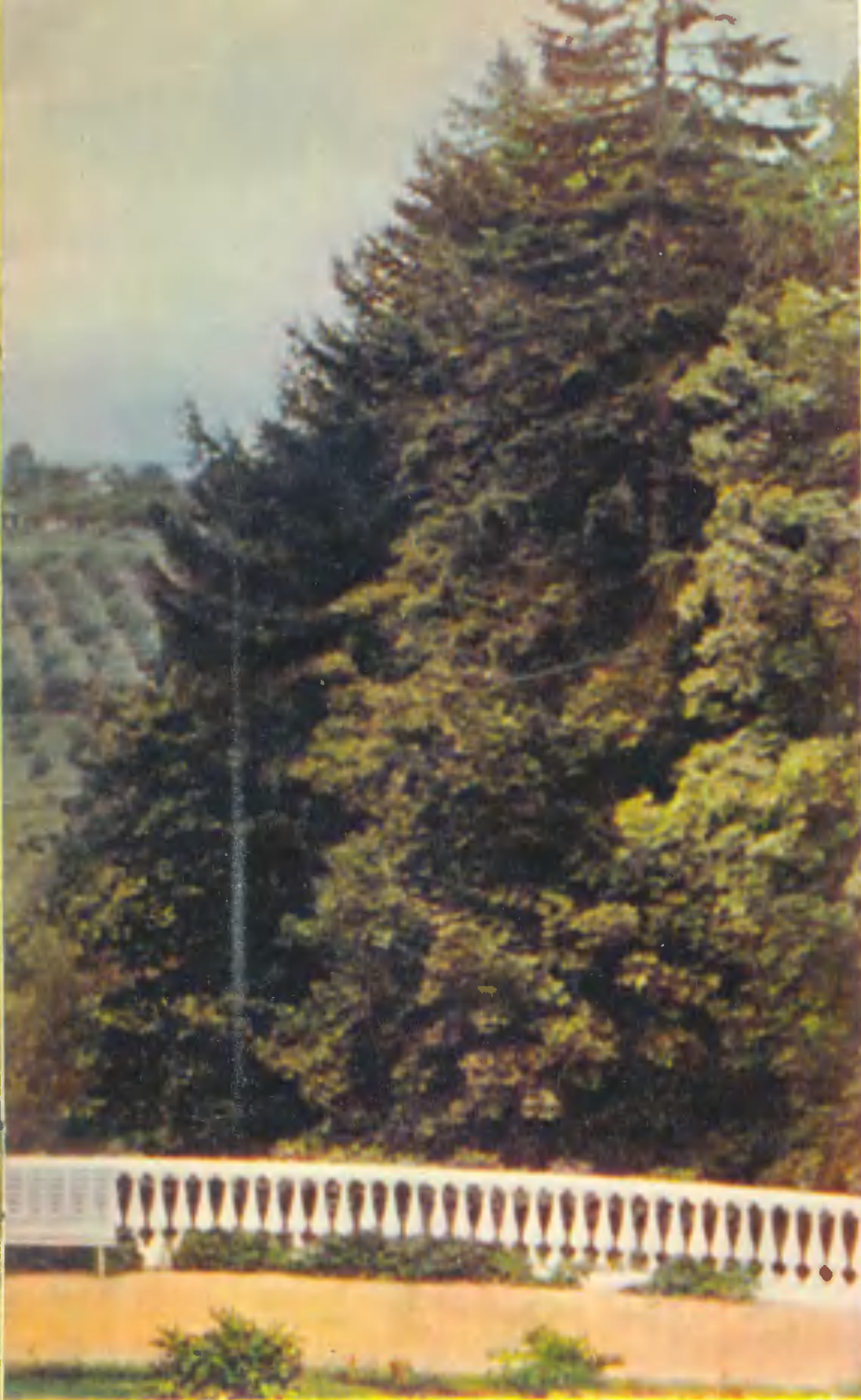
Вид на деревню Горки. A view of Gorki village Vue sur le village de Gorki. Ansicht des Dorfes Gorki