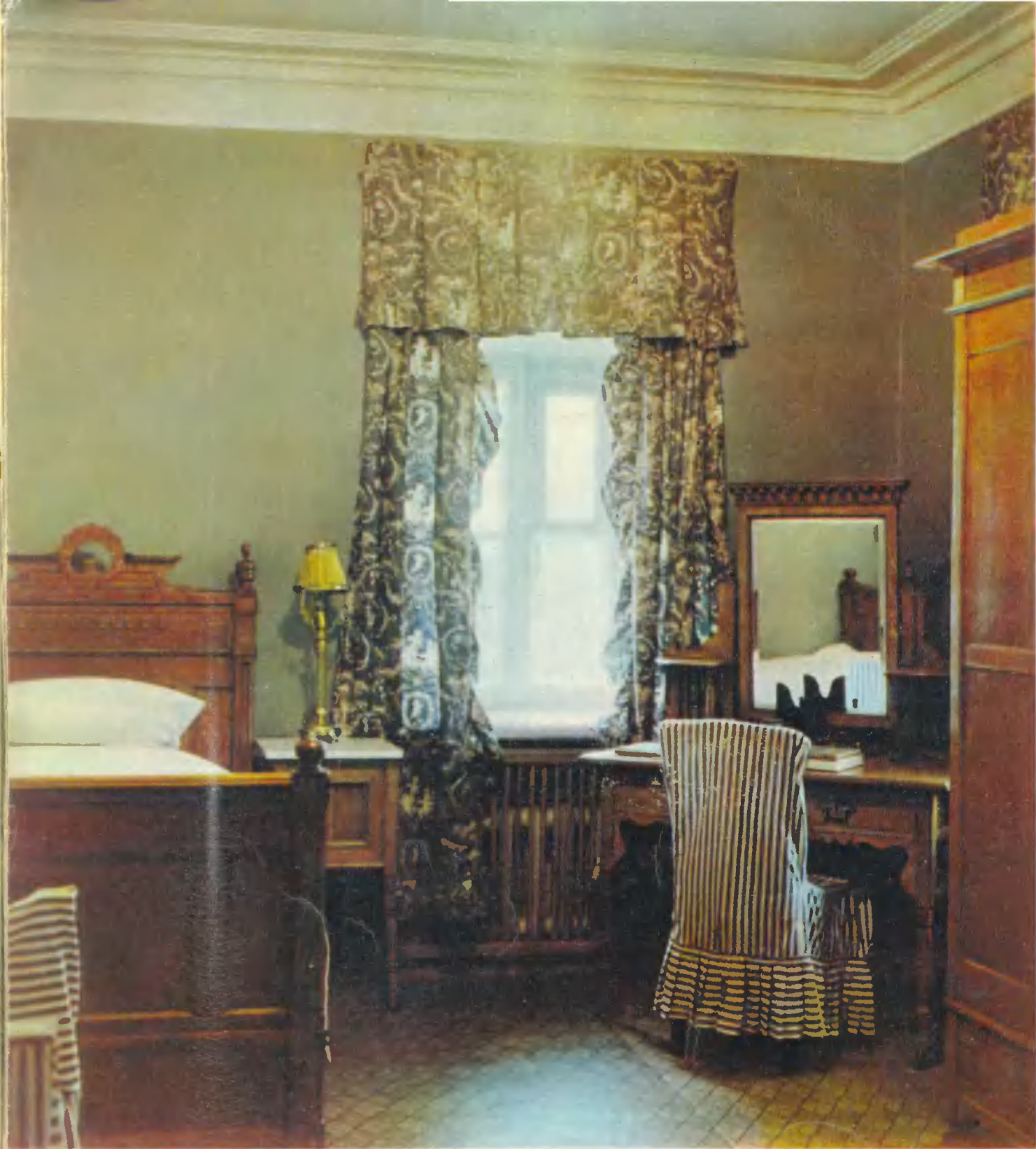
Комната В. И. Ленина в северном флигеле. Lenin's room in the north wing La chambre de Lénine au pavillon Nord. W. I. Lenins Zimmer im nördlichen Flügel